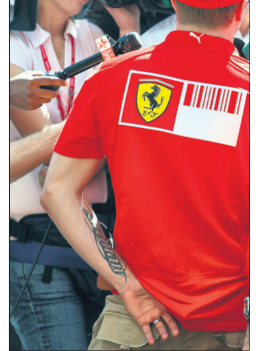
Kimi Räikkönen lähtee tavoittelemaan Ferrarin kanssa toista maailmanmestaruutta peräkkäin.